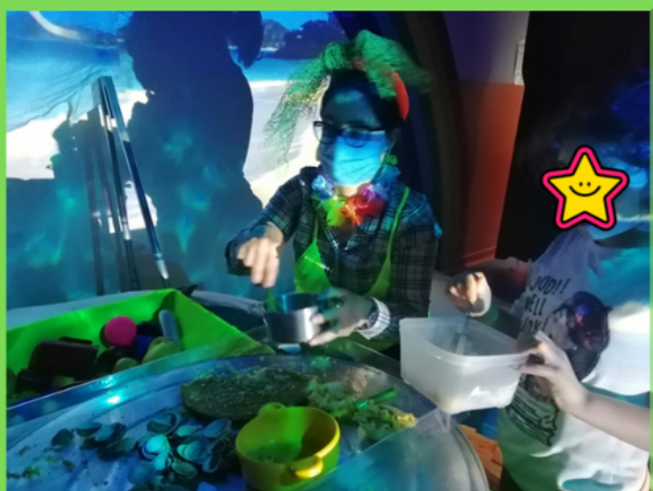
I.C. "Alessio Narbone"

L'idea progettuale nasce nel 2015 dall'iniziativa di docenti specializzati dell'IC Narbone che si mettono alla ricerca di soluzioni idonee per soddisfare i reali bisogni di alunni in condizione di disabilità complessa .